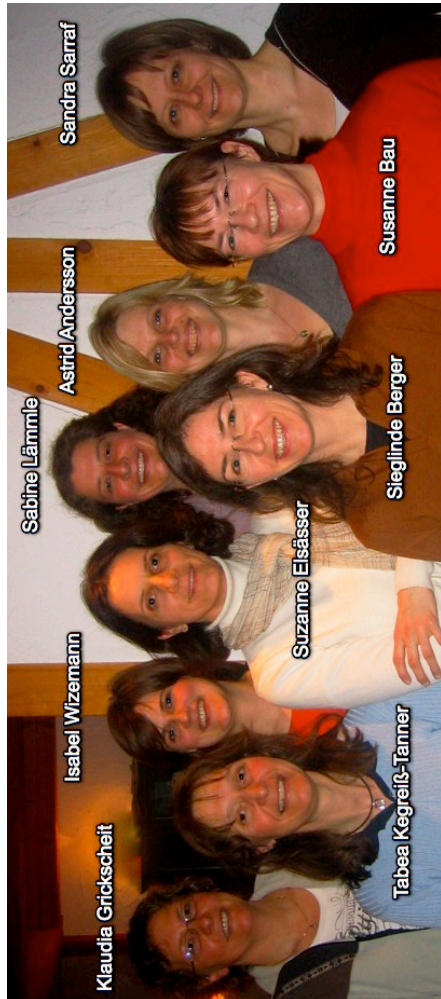
Stand: März 2009/SS

Fragen zu den einzelnen Angeboten beantworten euch die jeweiligen Ansprechpartner.